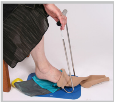
HJÆLPEMIDLER TIL KOMPRESSIONSSTRØMPER