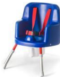
Varenr: 138292 HMI nr: 26721