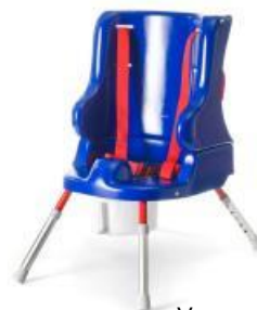
Varenr: 138291 HMI nr: 26722