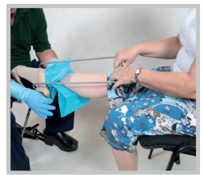
HJÆLPEMIDLER TIL AFLASTNING AF HJÆLPERNE