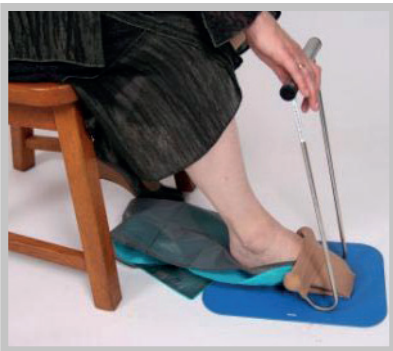
HJÆLPEMIDLER TIL KOMPRESSIONSSTRØMPER